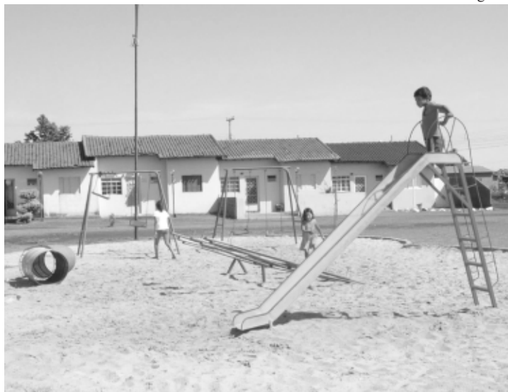
Reforma do parquinho facilitou a vida das crianças

A Secretaria de Serviços Urbanos fez a limpeza geral da área, retirou todos os brinquedos estragados e trocou por novos (gangorras, balanços, escorregadores e túneis), plantou árvores no parque, fez a troca da areia velha