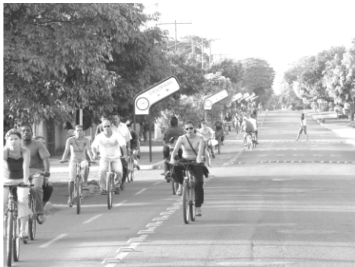
Maioria dos douradenses que usa a bicicleta como meio de transporte utiliza pistas exclusivas implantadas pela Prefeitura

Ele lembrou que, em recente levantamento pelas