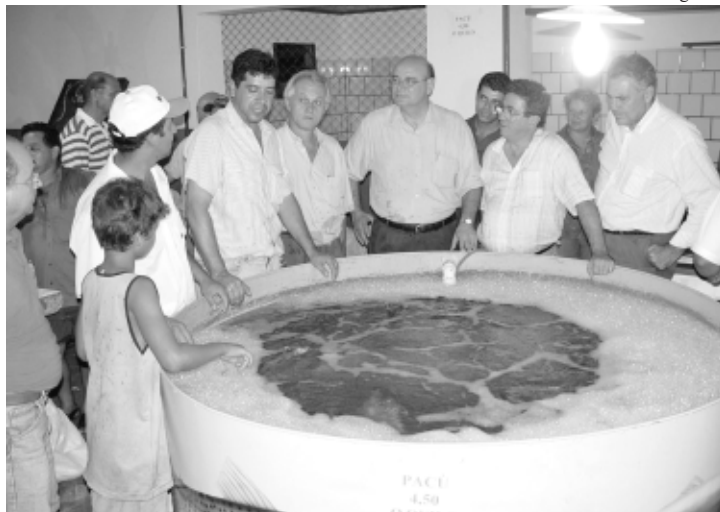
Peixes vivos estão abrigados em tanques instalados no interior do Parque Antenor Martins

Desde às 8h desta terça-feira, a população poderá comprar peixes das espécies pacu e tambacu a R$ 3,00 quilo; pintado a R$ 7,00 o quilo; catfish a R$ 4,50 o quilo e piraputanga e espécies semelhantes a R$ 4,00 o quilo. Os tanques para os peixes terão o acompanhamento de técnicos da Semag e Idaterra, durante todo o período de venda.