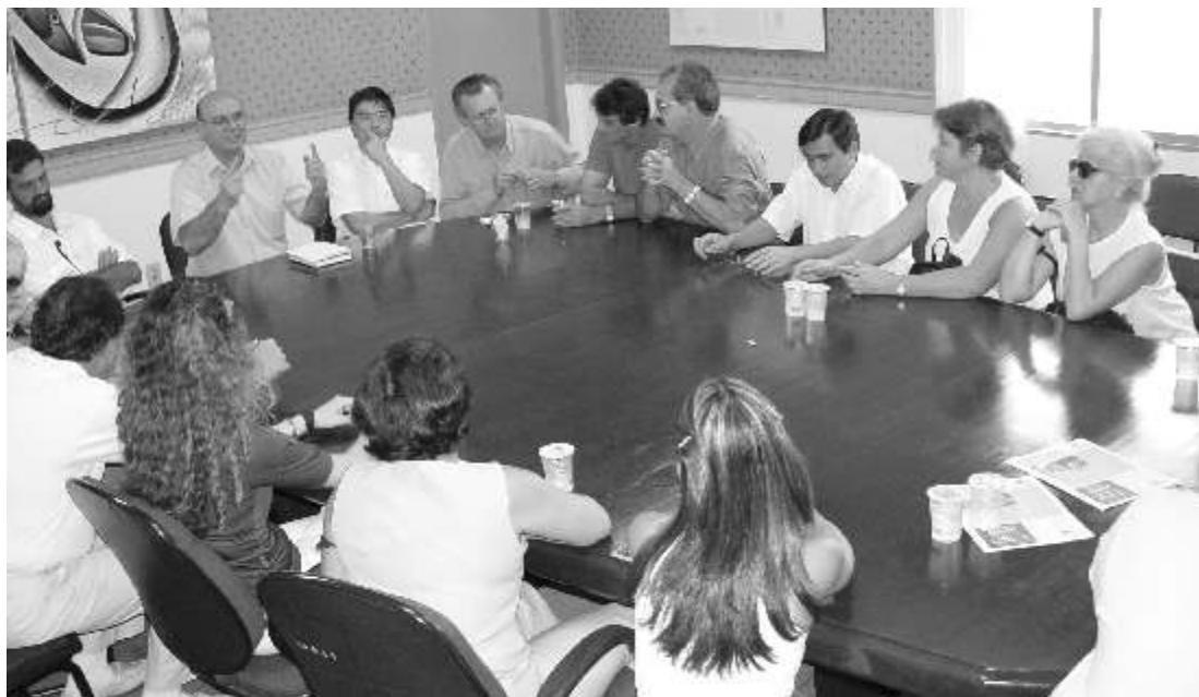
Tetila garantiu o repasse de R$ 200 mil em parceria com o Governo do Estado - solução emergencial

Conforme o prefeito, a administração municipal está no limite e não tem condições de quitar a dívida com o hospital, pelo menos, neste momento. “Tudo que o município arrecada com o IPTU é utilizado na amortização da dívida com o INSS, que somam cerca de