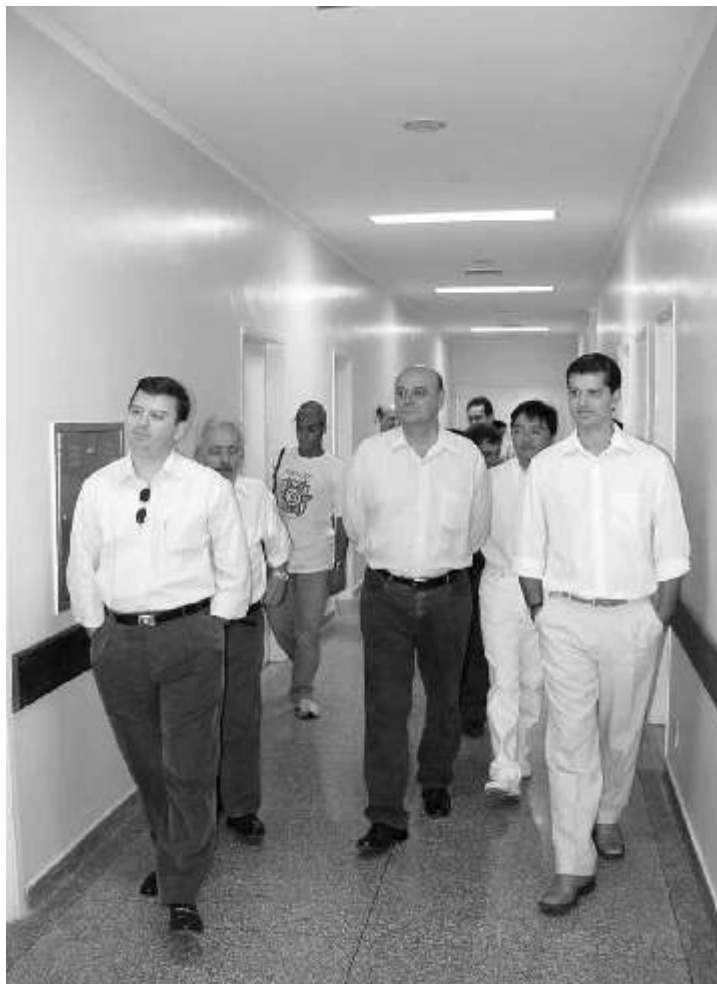
Tetila leva promotor estadual e procurador federal ao HU

Visitantes – O promotor e o procurador foram convidados pelo prefeito para conhecer as novas instalações. “Uma das razões pela qual viemos é para conhecer o HU, principalmente diante de uma possibilidade do fechamento do