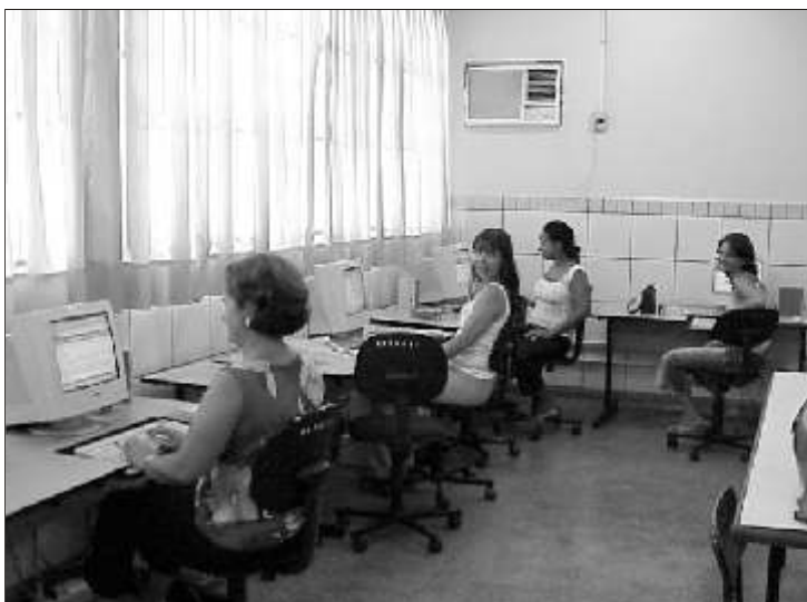
Iniciativa faz parte do projeto de inclusão digital da Administração Popular