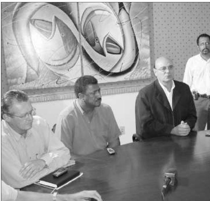
Prefeito substitui secretários de Fazenda e de Governo