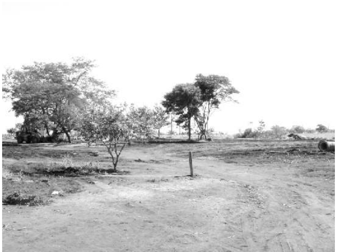
Shopping será instalado numa área de 100 mil metros quadrados, gerando mais de mil empregos

O investimento também será responsável pela geração de mil empregos, entre diretos e indiretos. O Grupo TSB já estava executando o projeto há mais de um ano em meio e serão 26 mil metros quadrados de área construída no shopping. A obra total terá aproximadamente 56 mil metros quadrados. O lançamento oficial da obra acontece em aproximadamente 40 dias e o prazo previsto para conclusão do empreendimento fica