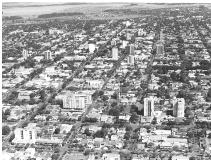
Com pagamento da dívida, despesas com prestação de serviço, custeio da máquina e salários teriam que ser cortados durante 20 meses

R$ 60 milhões e 257 mil reais, é referente a saldo devedor do município com o Instituto Nacional de Seguridade Social (INSS). Em outras palavras, é uma dívida que a Prefeitura tem com o INSS por não ter recolhido a previdência social do funcionalismo por vários anos.