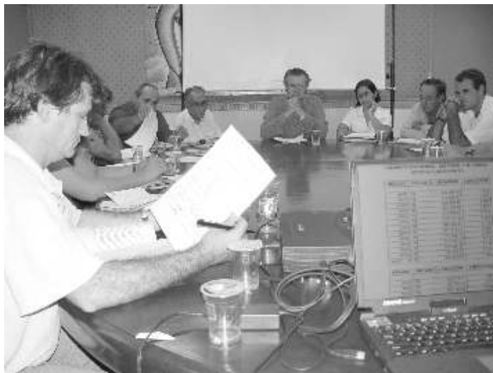
Equipe da Prefeitura e Simted durante rodada de negociações

Biasotto apresentou números relativos às receitas e despesas do Município com a Educação Fundamental. O secretário disse que “a transparência tem sido uma marca das negociações da atual administração, e que o Município está aberto para receber sugestão de alternativas ao orçamento que permitam chegar-se a um “índice satisfatório e ao mesmo tempo plausível de reajuste”. Dos dois lados da mesa, buscando o entendimento, professores: